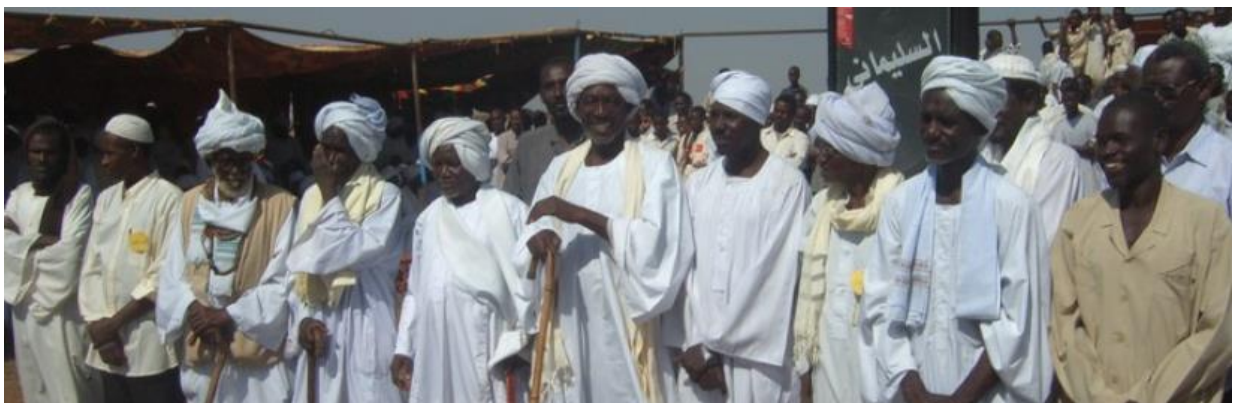
Verantwortliche vor Ort in Hilat Al Bir

Dieses Frühjahr haben wir ein neues Projekt eingereicht und vom BMZ bewilligt bekommen. Dies ist ein sehr vielseitiges Projekt, beinhaltet es doch in Hilat Al Bir und Umgebung das Bauen, Ergänzen und Erneuern von Kindergärten und Basisschulen, den Bau einer Schule für Gehörlose und Maßnahmen zur Stärkung des Vereins.