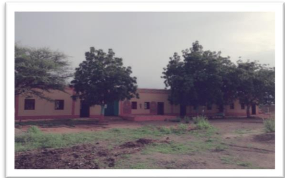
Schule in Hilat Ismael: Drei Klassenzimmer und ein Lehrerraum, Sanierung des Bestands und Ausstattung