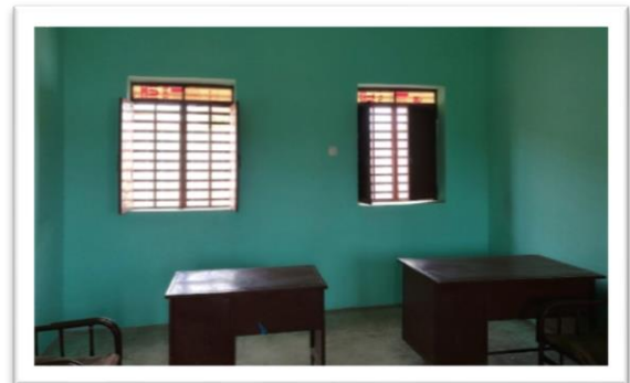
Schule in Erediba. Vier neue Klassenzimmer und zwei Lehrerbüros, Sanierung des Bestands und Ausstattung