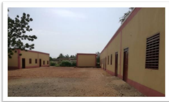
Schule in Alqalaa: Erweiterung und Sanierung der Mädchen- und der Jungenschule

Es gibt in der Region viele nur teilweise gebaute Basisschulen. Oft sammeln die Gemeinden und finanzieren einige Räume und das Geld reicht nicht, um die Schule fertigzustellen. Viele der bereits gebauten Klassenzimmer sind in sehr schlechtem Zustand. Mit Hilfe unseres Vereins und mit Förderung durch das Bundesministerium für wirtschaftliche Zusammenarbeit und Entwicklung (BMZ) werden im aktuellen Projekt bis Ende 2018 in 12 Dörfern Schulen instandgesetzt, die fehlenden Klassen- und Lehrerzimmer gebaut und alle Räume ausgestattet.